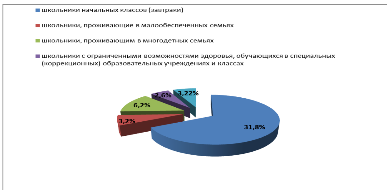
Рис.5.2. Категории учащихся ГОУ Санкт-Петербурга, пользующихся горячим льготным питанием

Ниже на Рис.5.2 представлены категории учащихся ГОБУ Санкт-Петербурга, пользующихся горячим льготным питанием.